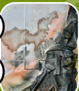
CAPILLA DEL MUSEO