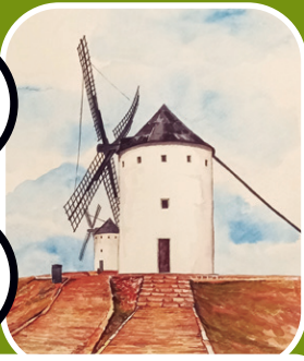
CAPILLA DEL MUSEO