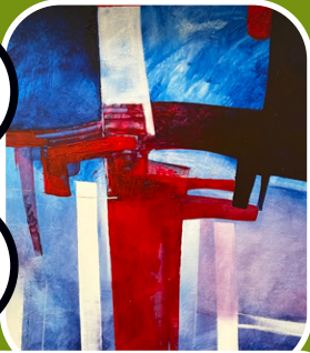
SALA LUISA ALBERCA