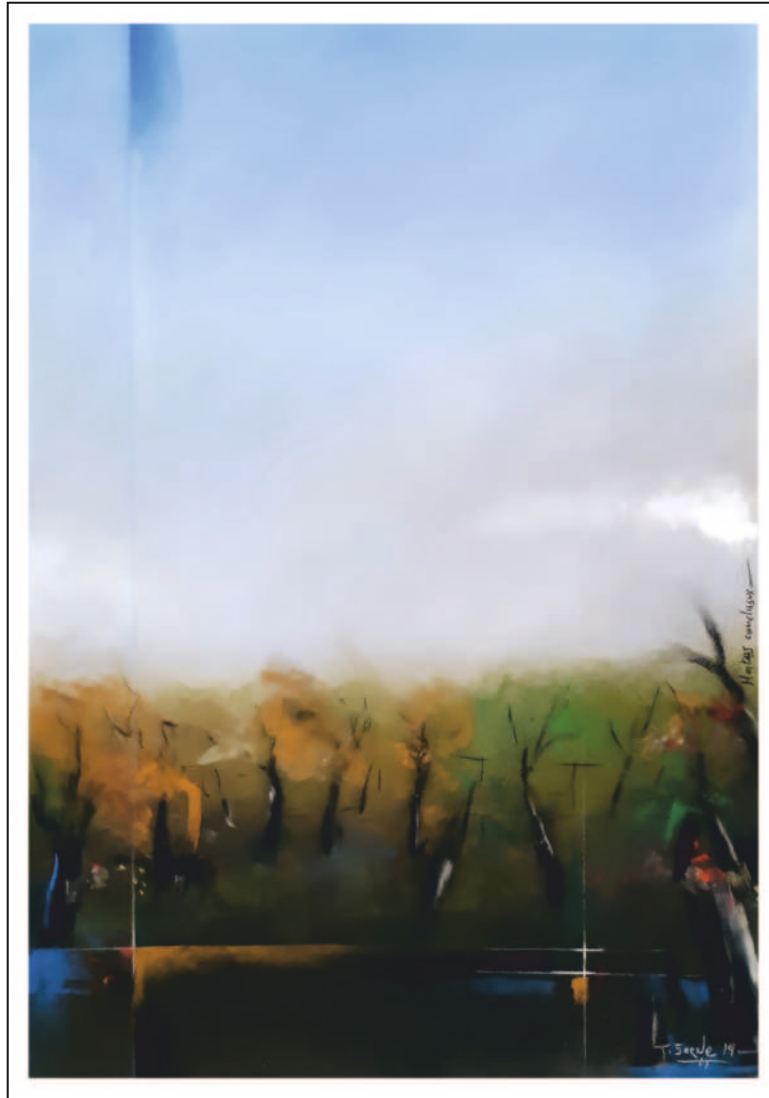
“Hortus conclusus”. 50x35. Pastel sobre papel Pastelmat