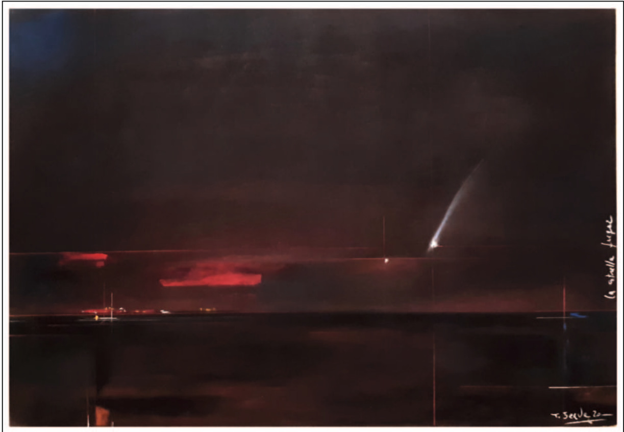
“La estrella fugaz (estudio en negro)”. 35x50. Pastel sobre papel Pastelmat