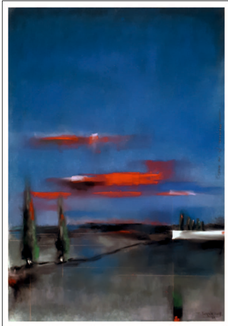
“Ocaso en el camino”. 50x35. Pastel sobre papel Pastelmat