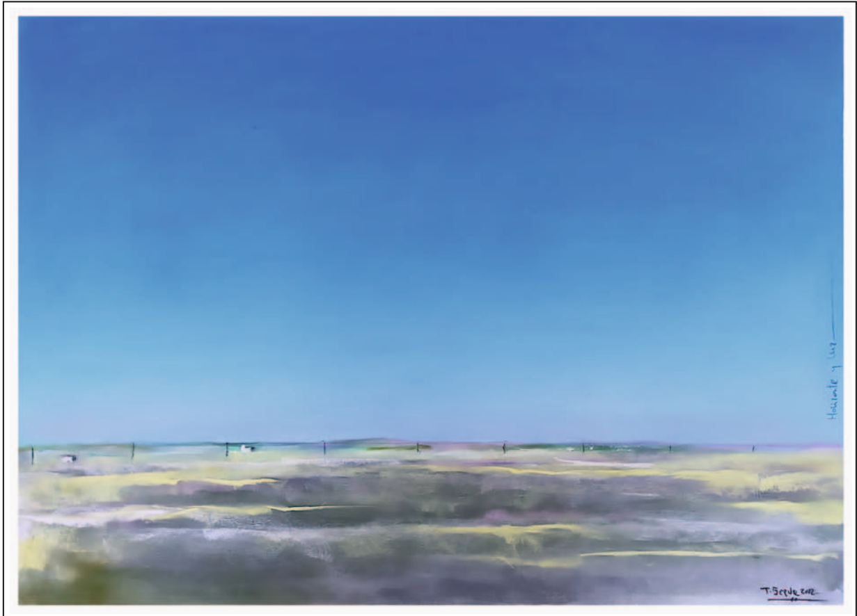
“Horizonte y luz”. 50x70. Pastel sobre papel Pastelmat