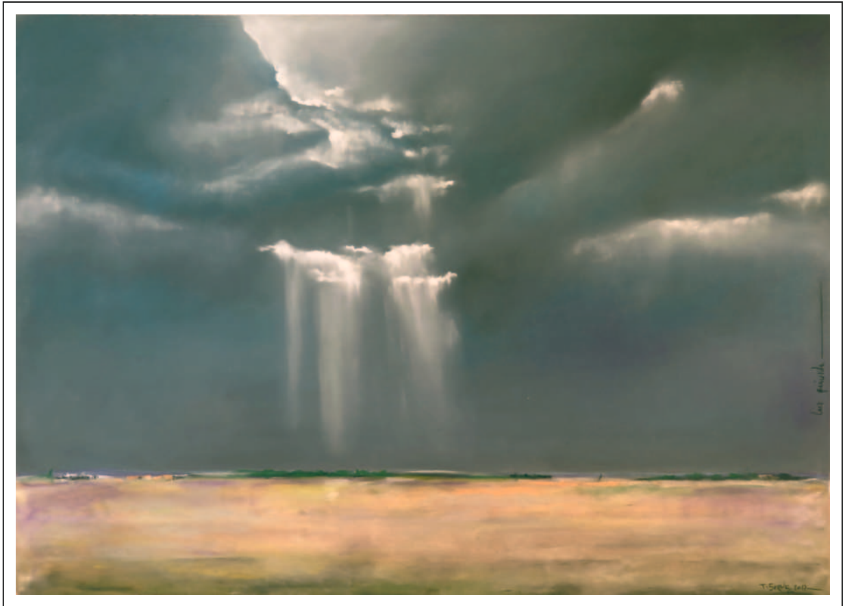
“Luz grávida”. 50x70. Pastel sobre papel Pastelmat