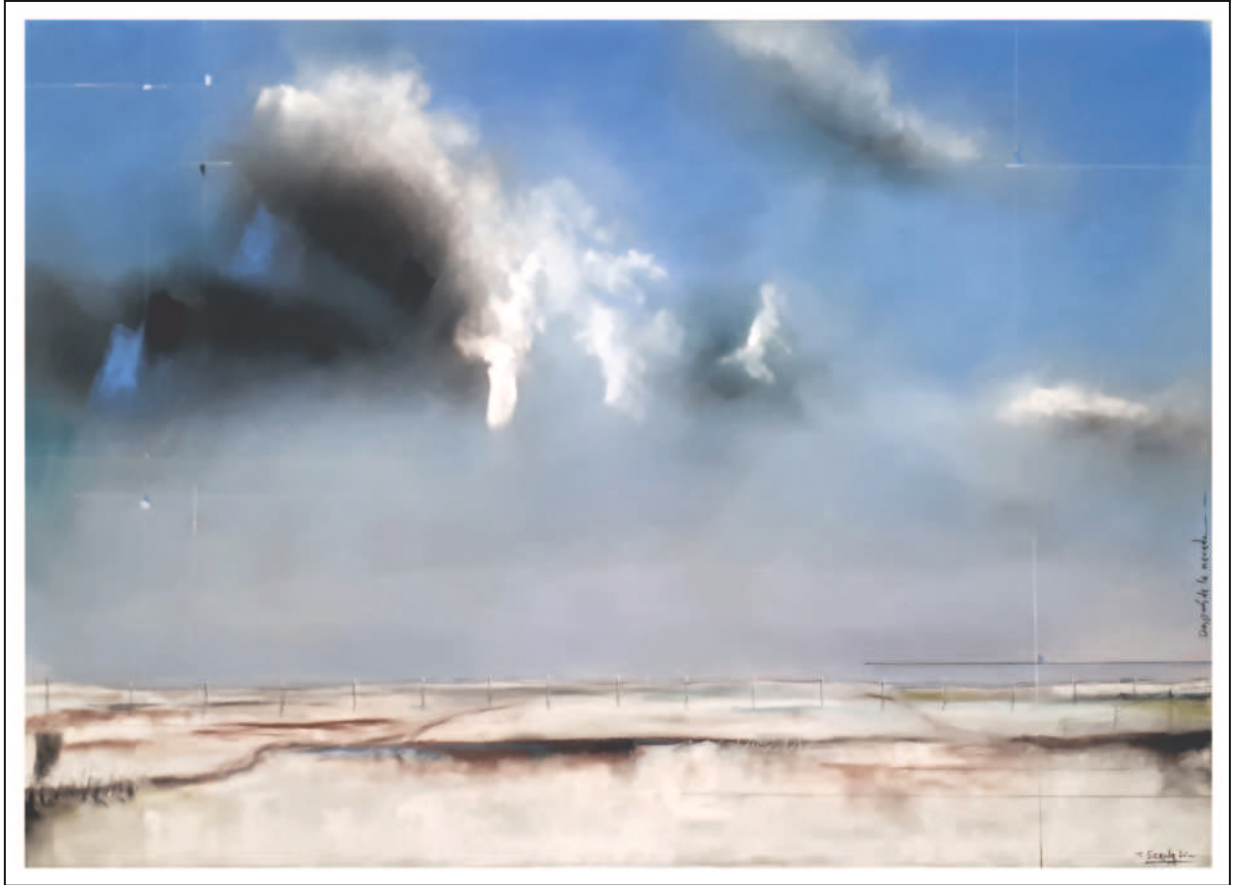
“Después de la nevada”. 50x70. Pastel sobre papel Pastelmat