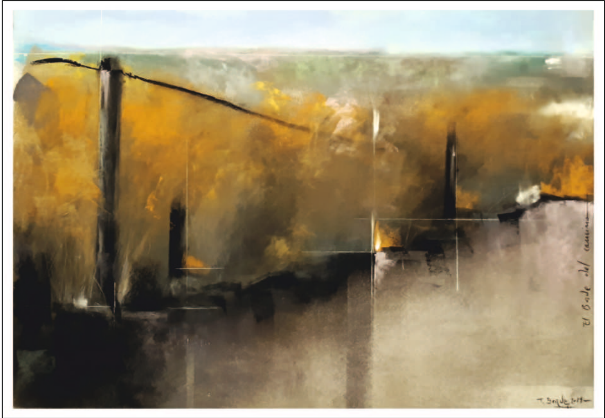
“El borde del camino”. 35x50. Pastel sobre papel Pastelmat