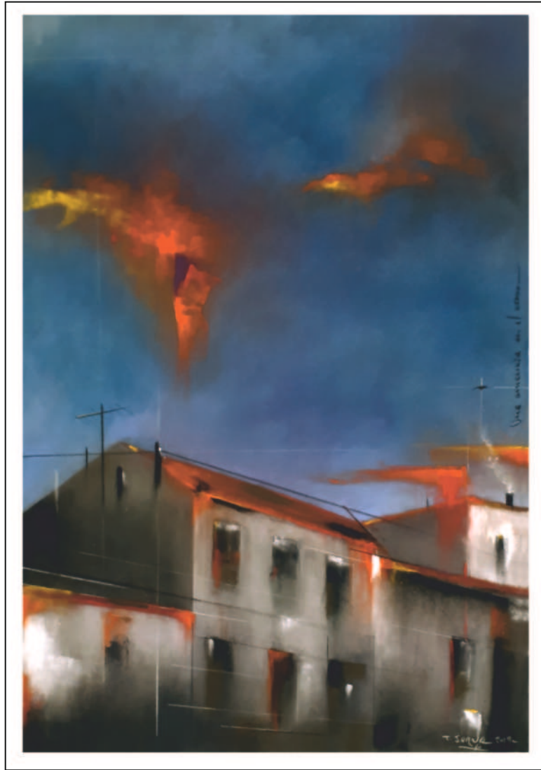
“Una amenaza en el ocaso”. 50x35. Pastel sobre papel Pastelmat