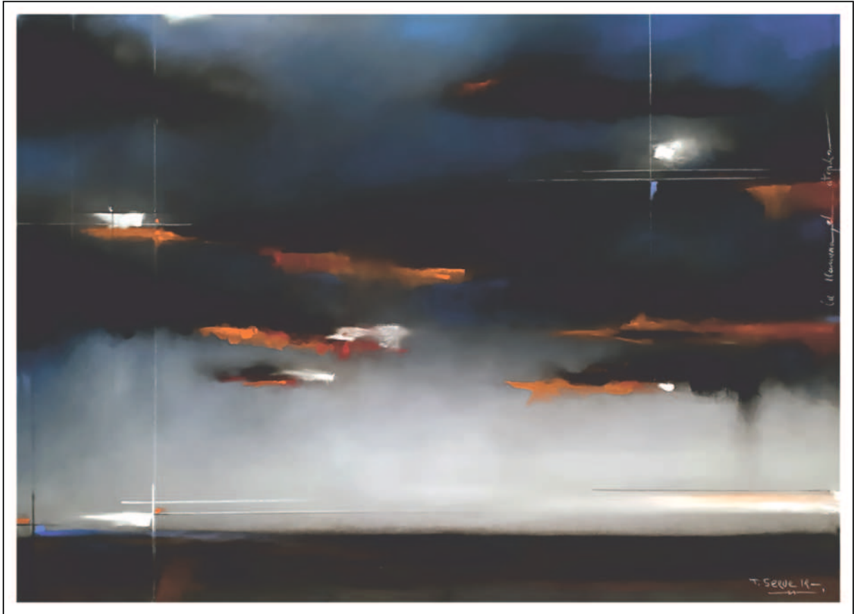
“La llanura, al atardecer”. 35X50. Pastel sobre papel Pastelmat