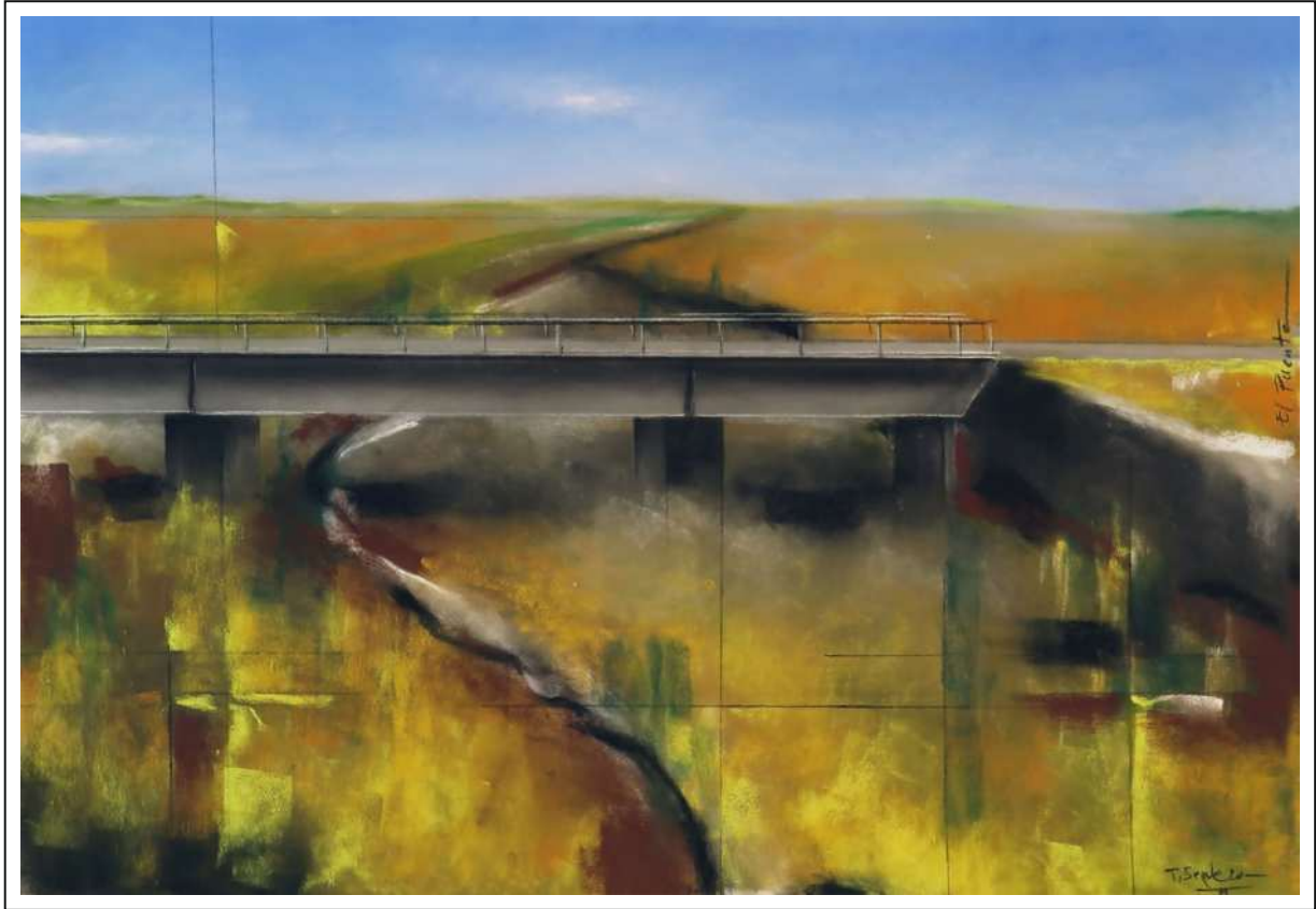
“El puente”. 35x50. Pastel sobre papel Pastelmat