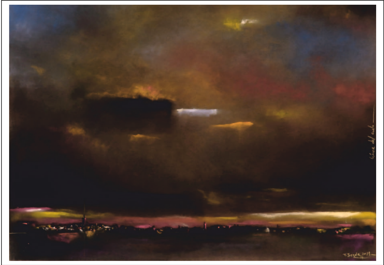
“Línea del cielo”. 35x50. Pastel sobre papel Pastelmat