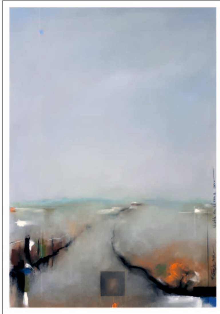
“Niebla en el cauce seco”.50x35. Pastel sobre papel Pastelmat