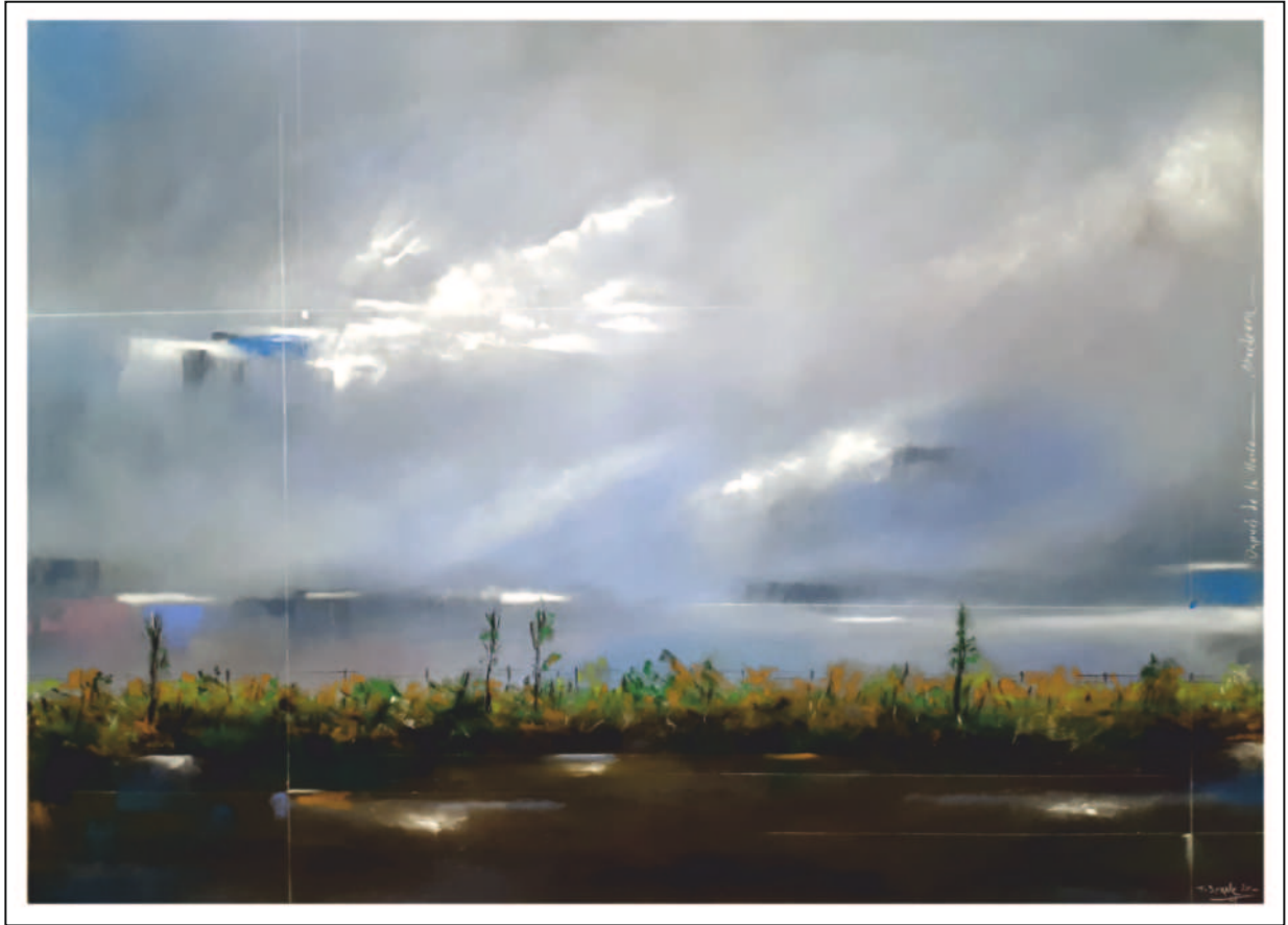
"Después de la lluvia. Atardecer". 50x70. Pastel sobre papel Pastelmat