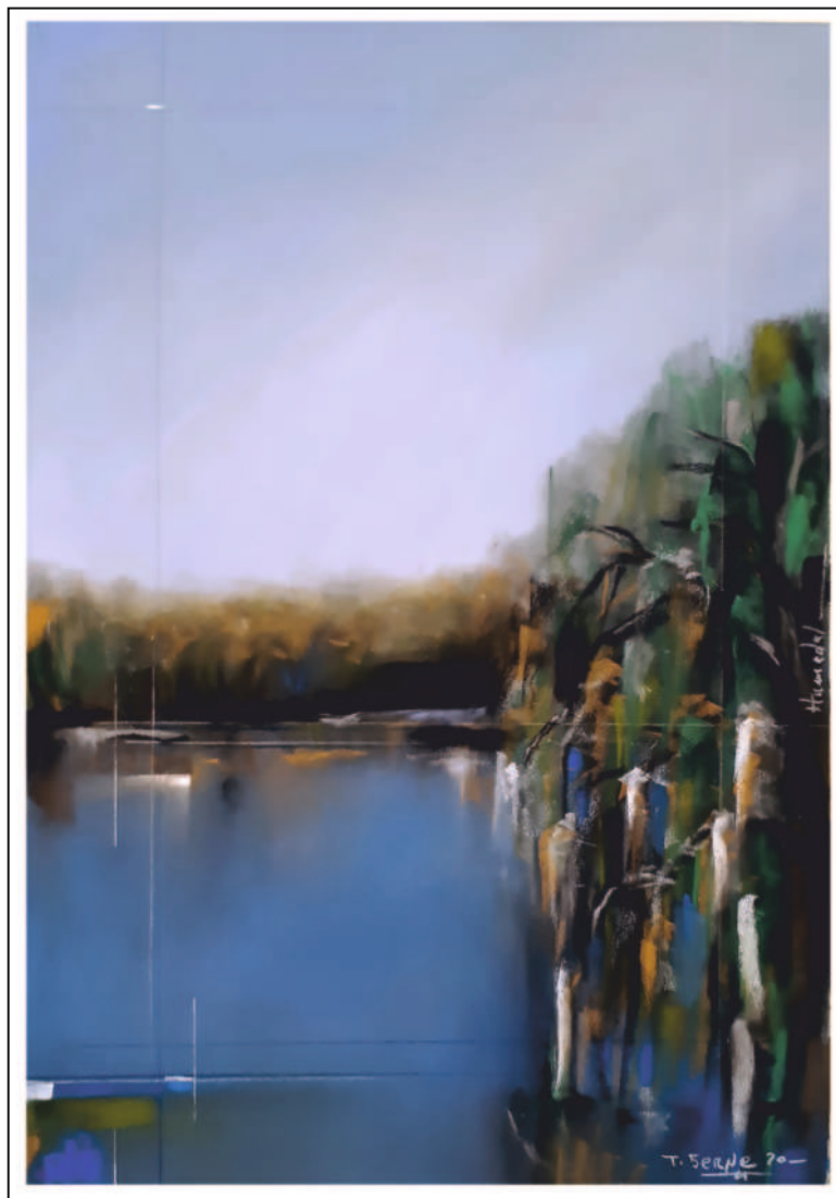
“Humedal”. 50x35. Pastel sobre papel Pastelmat