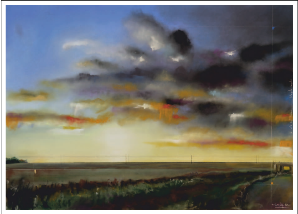
“La vía del tren. Atardeciendo”. 50x70. Pastel sobre papel Pastelmat