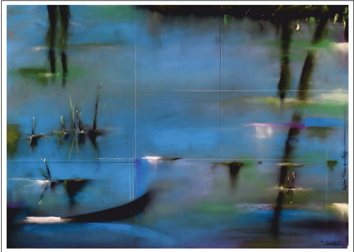
“Aguas tranquilas”. 50x70. Pastel sobre papel Pastelmat