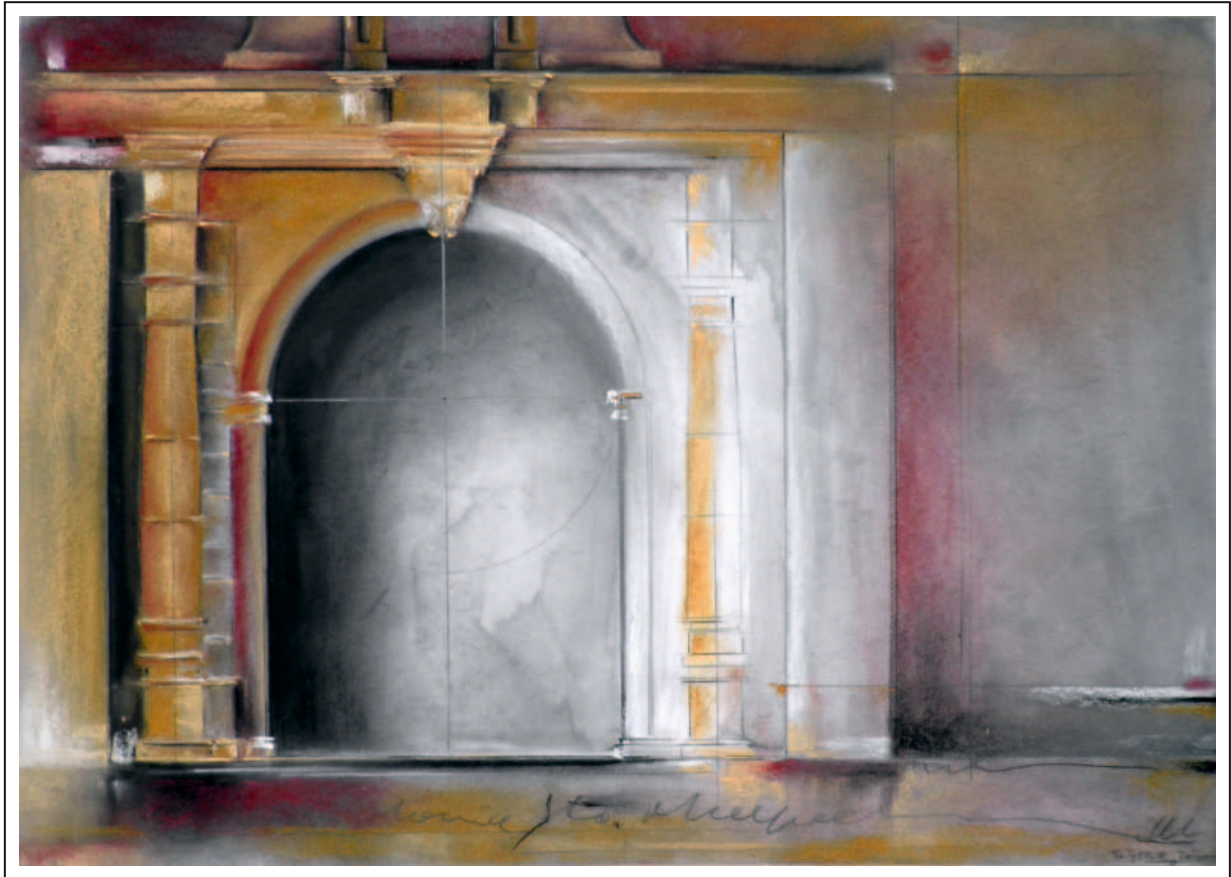
"Santa María la Mayor" 50x70. Pastel sobre papel hecho a mano