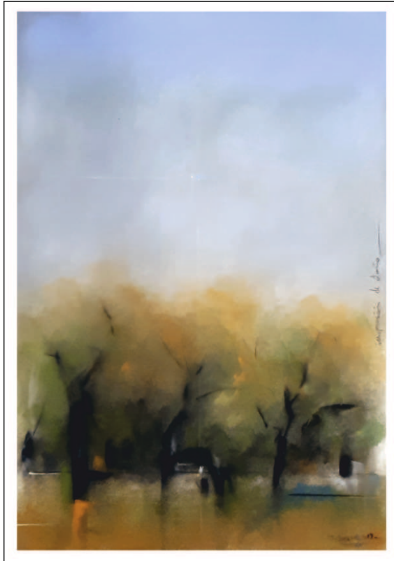
“Impresión de otoño”. 50x35. Pastel sobre papel Pastelmat