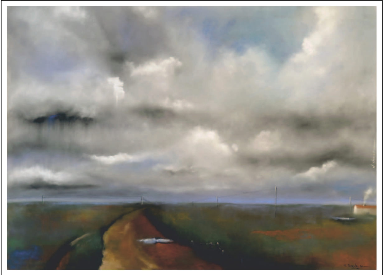
"El charco". 50x70. Pastel sobre papel Pastelmat