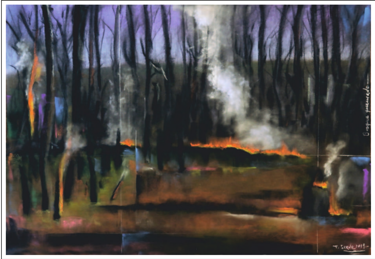
“Bosque quemado”. 35x50. Pastel sobre papel Pastelmat