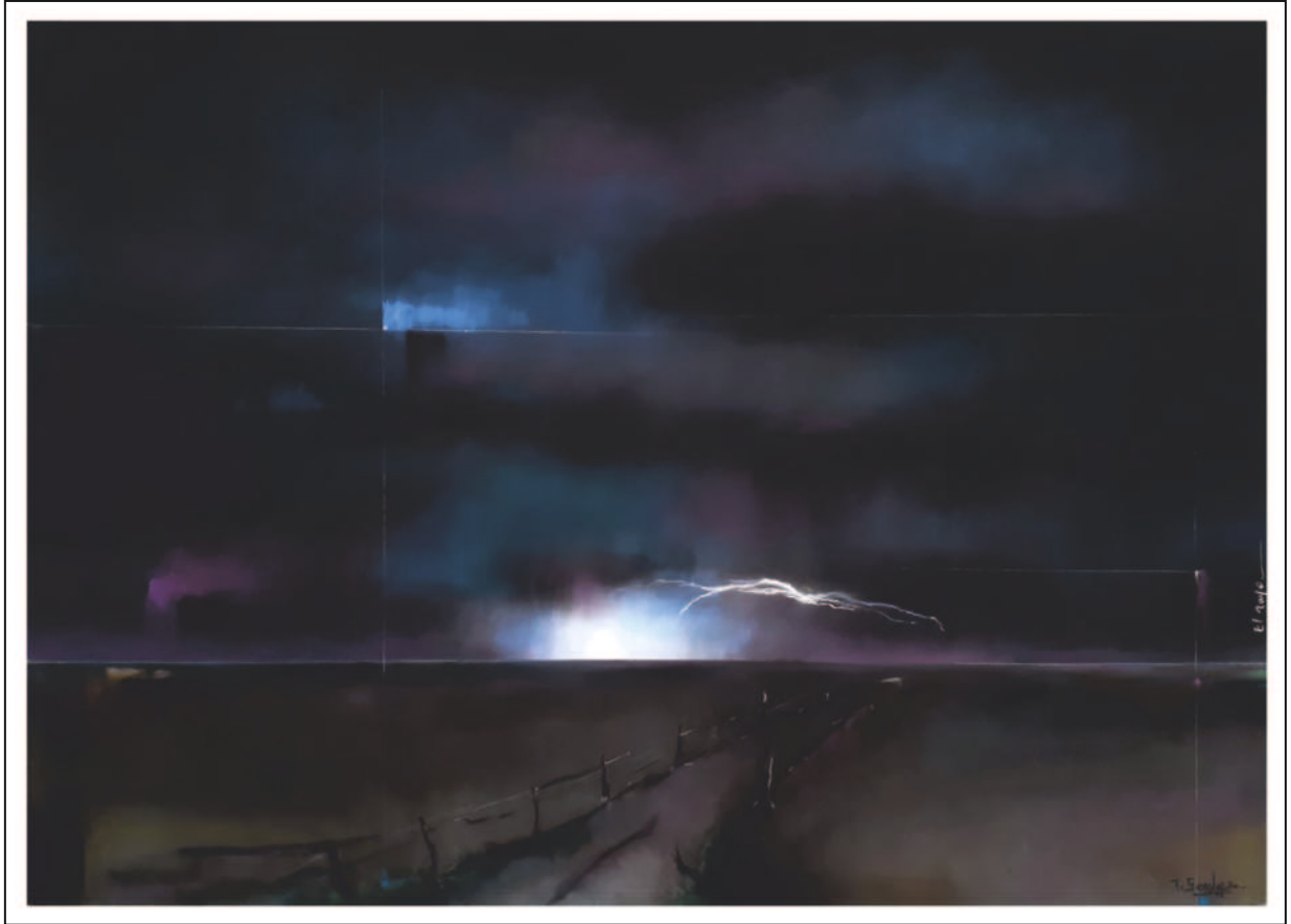
“El rayo”. 50x70. Pastel sobre papel Pastelmat