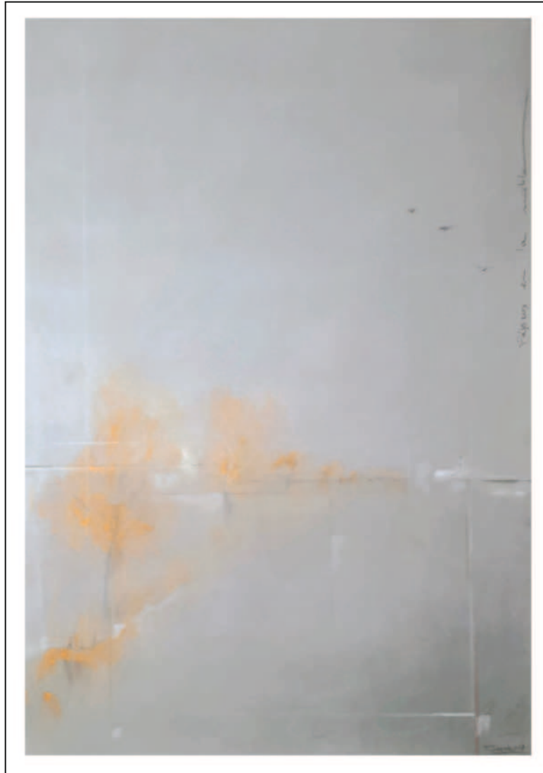
“Pájaros en la niebla”. 50x35. Pastel sobre papel Pastelmat