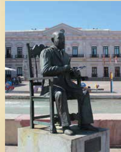
Existe una escultura del pintor situada en la Plaza de España

La parte superior del museo alberga exposiciones temporales a destacar el Certamen Internacional de Pintura "Ciudad de Alcázar" y el Certamen Nacional de Pintura Rápida Nocturna "Ángel Lizcano Monedero"