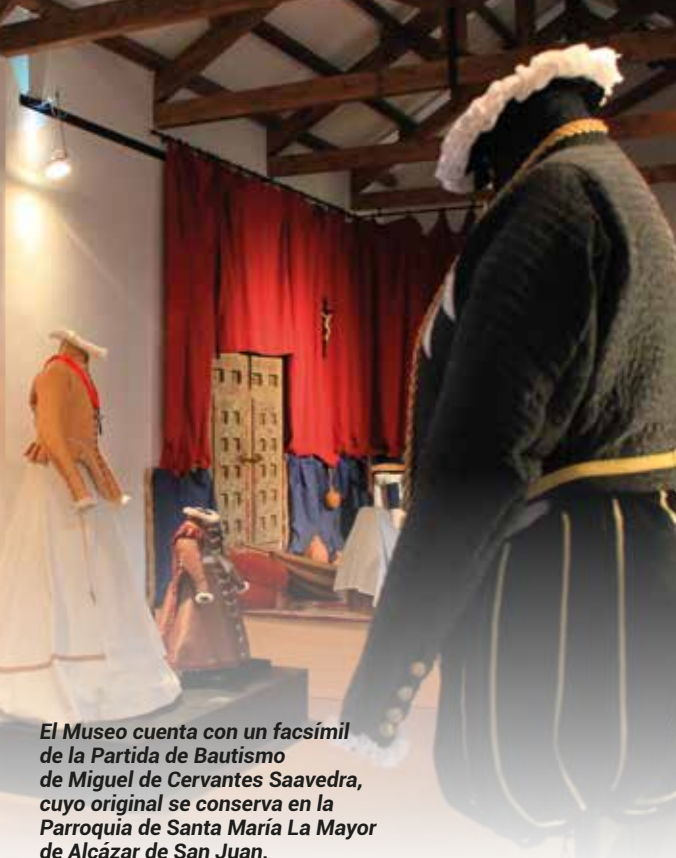
El Museo cuenta con un facsímil de la Partida de Bautismo de Miguel de Cervantes Saavedra, cuyo original se conserva en la Parroquia de Santa María La Mayor de Alcázar de San Juan.

También cuenta con recursos audiovisuales, manipulativos e interactivos con los que poder experimentar a lo largo de toda la visita. Esto hace que sea especialmente atractivo para visitas familiares con niños.