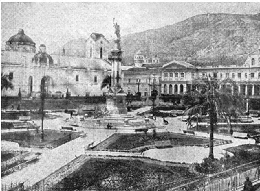
Vista de la Plaza Mayor de Quito, con la Iglesia Catedral antes de su reparación de la Torre 108 .

la arena trayendo los dichos materiales en sus hombros, mulas y caballos de rúa; y así, en poco más de tres años se hizo el más suntuoso templo que hay en el Perú. [...] Administró la diócesis por elección del Cabildo eclesiástico confirmada por Su Majestad y los señores de Su Real Consejo y en atención al trabajo que tiene le señalaron de salario mil pesos anuales [...] Honrado, limpio y no pobre y conservando su dignidad eclesiástica se restituyó a su patria, adonde llegó el 16 de agosto de 1570, muriendo en su casa de Alcázar el 19 de febrero de 1595 [...] Quiso a su Catedral con verdadero amor, la dotó de campanas, ornamentos, cruces y cálices y especialmente de una custodia de plata que pesó 3.000 castellanos y un espejo grande que compró en 1564 para adornarla”.