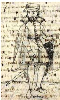
El Licenciado Falcón "persona de ciencia y conciencia" 99 .

"Francisco Falcón Díaz en su calidad de procurador y defensor de los indios, hizo una exposición sobre los agravios a los indios por los españoles en el Concilio II limense convocado por el arzobispo fray Gerónimo de Loaiza en 1567. Fue muy manifiesta la actitud pro indígena que demostró tener el licenciado Falcón desde cuando vino de España para residir en Popayán. En el Perú mantuvo igual actitud jurídica, política y económica, pues el licenciado Falcón pidió en numerosos escritos que se remediara las ánimas y conciencias de los españoles para que se quitasen los impedimentos que se habían puesto a la conversión e instrucción de los indios u que se evitaran la cantidad de agravios que los indígenas recibían. Su defensa de los indígenas y denuncias a los curas le llevó a una enemistad con el clero e incluso le impusieron la excomunión".