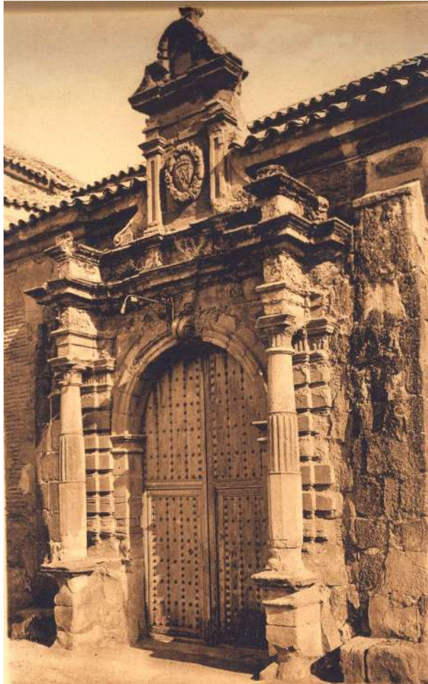
2.- Portada de la iglesia de Santa María.