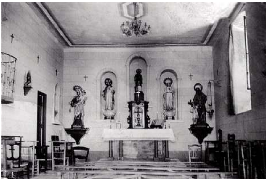
9.- Ermita de San Lorenzo en Alameda de Cervera.

Cuando se realizó la visita a Cervera el 16 de junio de 1655, los visitantes reconocieron el edificio religioso de la alcaidía, una ermita con la advocación de San Lorenzo, mártir que fue quemado en una parrilla en el siglo III. Estaba situada entre la casa-castillo de Cervera y el Soto, perteneciendo a la villa de Alcázar.