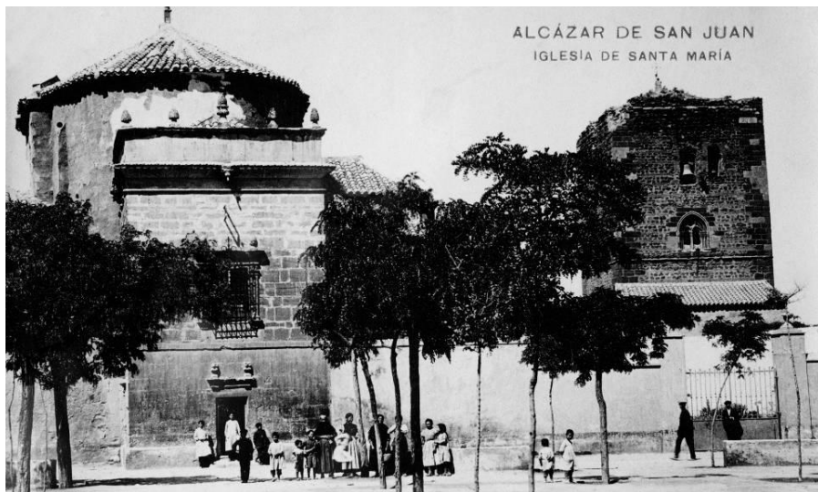
1.- Iglesia de Santa María.

A continuación fueron al altar de Nuestra Señora del Rosario, donde se hallaba otro sagrario con su llave y en el interior un copón grande de plata con algunas formas, situado sobre un ara con sus corporales. Después se trasladaron hasta la pila del bautismo "que esta a la parte de debajo de la dicha iglesia a la mano derecha" . Estaba cerrada con una reja de madera y dentro había un lebrillo lleno de agua y una alacena cerrada con llave, en la que se guardaban tres crismas de plata, dos de ellas juntas con el óleo de los catecúmenos y el crisma, mientras que en la tercera estaba el óleo de los enfermos, todo ello bien limpio 6 .