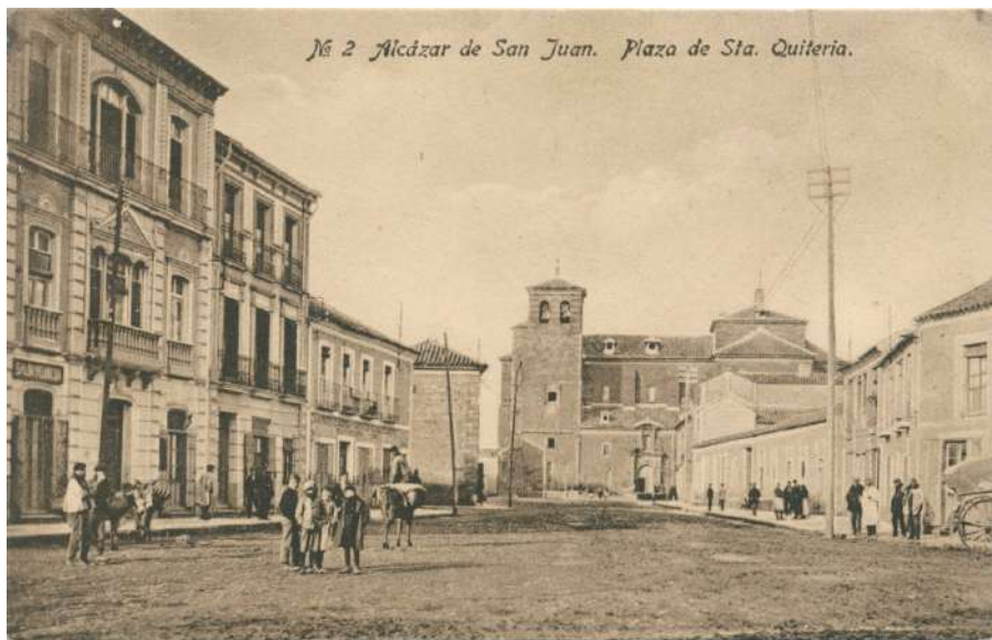
4.- Iglesia y plaza de Santa Quiteria.

A continuación fueron al altar del Santo Cristo, donde había otro sagrario, y en su interior un vaso grande de pie de plata, adobado y sobredorado con su cubierta del mismo metal, dentro del cual había gran cantidad de formas, para la comunión de los fieles. Desde allí marcharon a la pila de bautismo, que se encontraba en la parte de abajo del edificio, en una capilla a mano izquierda en la que había un barreño con gran cantidad de agua y una alacena cerrada con llave, donde se guardaban dos crismeras pequeñas de plata con su pie para el óleo y crisma, mientras que en una crismera algo mayor, con un plato pequeño también de plata, se guardaba el "olio ynfermorun". En una caja de madera forrada había otras tres crismeras de plata duplicadas, como reserva de las anteriores.