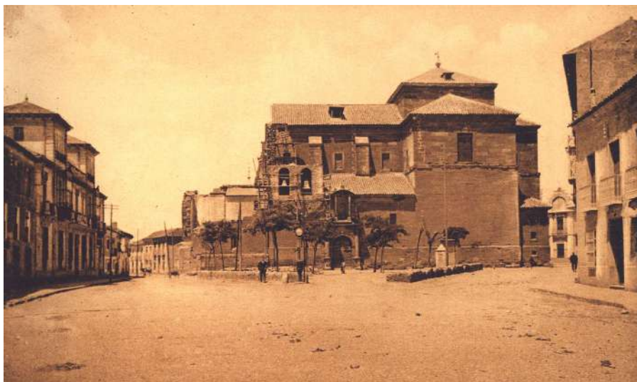
5.- Iglesia de Santa Quiteria, tras el hundimiento de 1921.