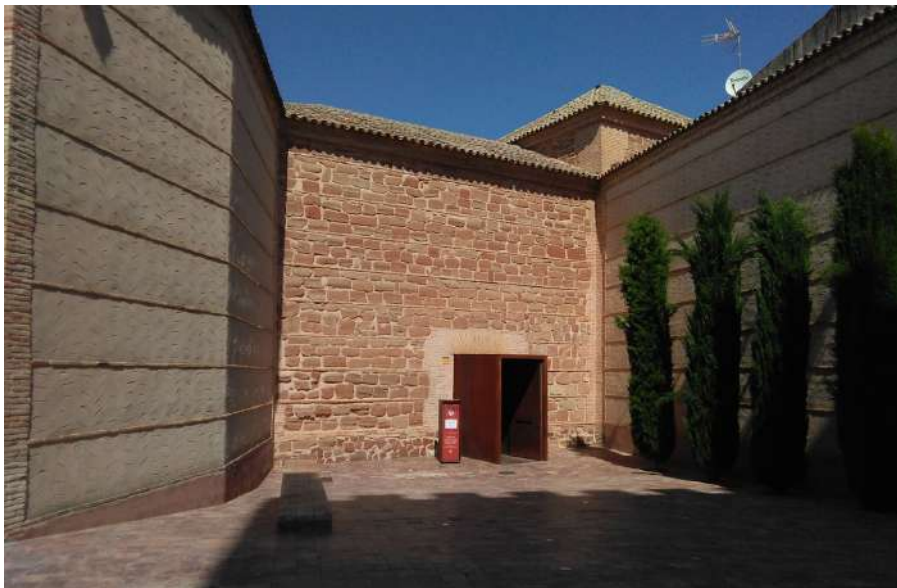
6.- Ermita de San Juan o capilla de palacio.

y actividades más importantes. Además de este acceso interior, contaba con una puerta principal que "sale a la plaça questa delante de las dichas casas" y otra por la que se entraba en la sacristía. Era una capilla buena de piedra de sillería con su tribuna. Contaba con dos altares, el mayor tenía una imagen de San Juan de bulto dorado y su ara, mientras que el otro estaba "frontero de la puerta por donde se entra desde la plaça" .