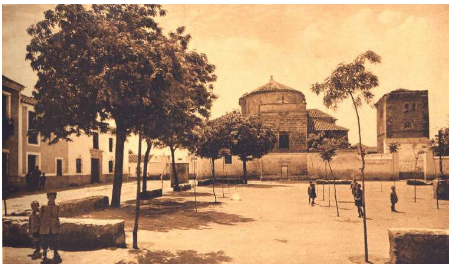
3.- Vista de la iglesia de Santa María y el Torreón.

Llevaba asociado la obligación de la cura de las almas y otorgaba a su titular la jurisdicción y gobierno de los fieles de una parroquia. La práctica totalidad de las parroquias de las localidades importantes tenían un beneficio curado, para asegurar la manutención e ingresos de los sacerdotes o priores que se encontraban al frente de ellas. En el caso de Alcázar de San Juan, eran freyles de la orden de San Juan, que habían contando con una larga y exigente formación en el convento de Santa María del Monte, y para mantener su estatus debían tener asegurados unos ingresos importantes, al igual que sucedía en el resto de pueblos pertenecientes al Campo de San Juan.