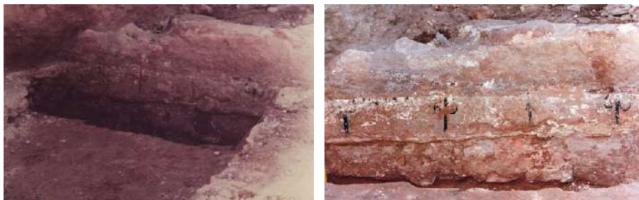
Figs. 20-21. Decoración pictórica parietal.

La fábrica de estos paramentos se componía de bloques de arenisca (unos, amarillo-verdosos y, otros, rojizos) bastante irregulares, sin desbastar y de tamaño mediano. Como conglomerante se utilizó cal o barro. El alzado de estas estructuras murarias posiblemente se completaría con material latericio y tapial, dispuesto sobre los zócalos de piedra. También en el subsuelo de la Plaza del Torreón encontramos abundantes ladrillos romanos, deparándonos una prueba del empleo de esa técnica edilicia.