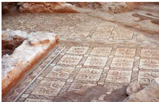
Fig. 19. Dos tramos de los mosaicos A y B.

Estos dos últimos mosaicos, que hasta el momento han permanecido inéditos y de los que más adelante ofrecemos un análisis pormenorizado, estaban cubiertos por una espesa capa de tierra arcillosa, de color rojizo. Ocupaban una superficie de aproximadamente 40 m 2 .