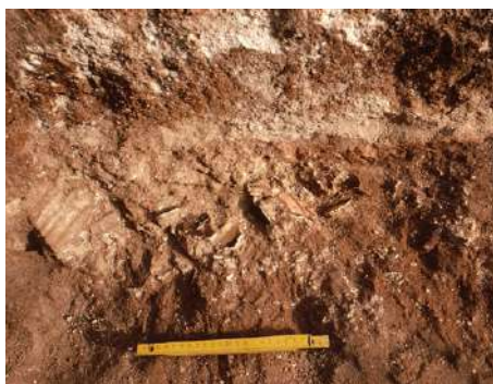
Fig. 24. Cama del mosaico, con un relleno de fragmentos cerámicos.

A ambos mosaicos se les adjudicó la misma cronología del primer ciclo musivo recuperado por el equipo de J. San Valero, en función de sus características estilísticas comunes, pues tenían una temática similar a la de los descubiertos en los años '50 (representaciones vegetales esquematizadas y motivos geométricos, muchos de ellos idénticos, baste contemplar las Figs. 2- 4, 25, 27-28 ó 5 y 29). Cabe recordar, en este sentido, la opinión del excavador del primer lote de mosaicos (SAN VALERO, 1957, 216), en sintonía con la del Comisario General de Excavaciones, J. Martínez Santa-Olalla (SAN MARTÍN, 1953, 33), respecto a que el conjunto aparecido en 1952-1954 correspondía a finales del siglo II o principios del III d.C., cronología que, insistimos, no concuerda con la emitida por la RAH y por J.M. Blázquez, esto es, el siglo IV d.C., que, también a nuestro entender, es la acertada, por las razones anteriormente expuestas.