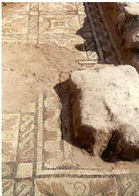
Fig. 30. En esta fotografía de uno de los mosaicos exhumados en los años '50 se puede apreciar que el diseño es idéntico al del Mosaico A (1982).

Es exactamente idéntico a uno de los descubiertos en los años '50 (BLÁZQUEZ, CMRE V, 1982b, 25-26, fig. 15, lám. 7, n.º 17), cuyo sistema compositivo también está realizado a base de casetones separados por calles de trenzas y una alternancia decorativa en los recuadros: mientras que unos están rellenos con aspas de hojas de acanto y flores de loto intercaladas, los otros incluyen polígonos romboidales de lados curvos reforzados externamente por hojas de acanto realizadas en silueta y complementados por rosetas de ocho pétalos en su interior. En el centro de estos cuadrados curvilíneos brotan zarcillos (Fig. 30).