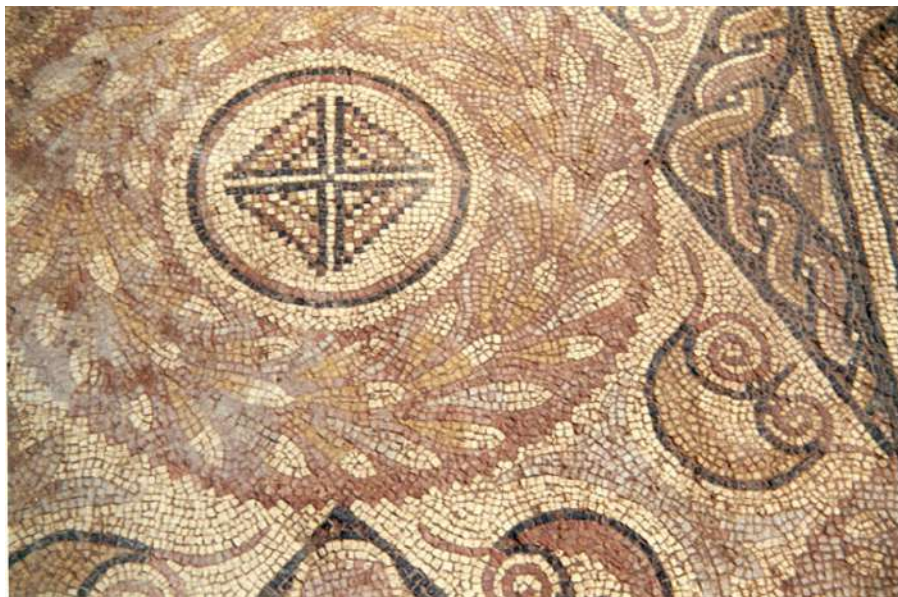
Fig. 16. Detalle de una de las coronas.

rojas, donde se inscribe una cruz de Malta (cuatro triángulos dentellados ribeteados por una hilera de teselas negras y enlazados por una tesela de color negro, sobre fondo blanco, Fig. 16).