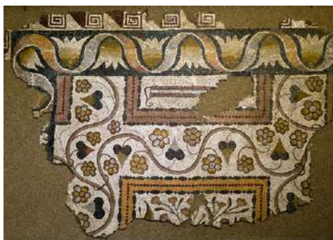
Fig. 11. Mosaico con motivos geométricos, vegetales y florales.

La ornamentación de otro de los fragmentos musivos alcazareños consta de rectángulos en espiral, como los de un mosaico de Huerta del Otero (Mérida) y otro de la villa de Los Quintanares (BLÁZQUEZ, CMRE V, 1982b, 26-27, lám. 10, n.º 18). Tiene, además, una ancha onda de cinta con corolas tetrapétalas, hojas lanceoladas, zarcillos y flores de seis pétalos (Fig. 11). Está acotado por una serie de rombos y elipses.