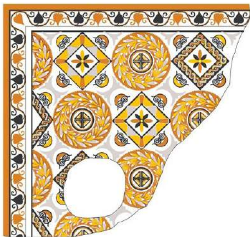
Fig. 15. Mosaico de las coronas de laurel. Dib.: García Bueno

La descripción y recopilación de paralelos formales realizada por J.M. Blázquez ( CMRE V, 1982b, 23-27) complementa y amplía el estudio llevado a cabo años antes por J. San Valero, difiriendo, no obstante, en la datación adjudicada por cada uno de ellos a la serie musiva, como ya hemos comentado.