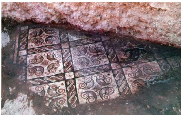
Fig. 29. Mosaico B.

Por el lado más corto se ensambla transversalmente con el anterior, del que está separado por el mencionado festón de cinta ondulada, utilizado en la zona de unión de estos dos posibles deambulatorios de un peristilo. Decora un pasillo cuya longitud no se puede conocer con exactitud, pues durante la intervención realizada en 1982 sólo se descubrió un tramo de unos 5,75 m de longitud por 2,88/3 m de anchura. Al igual que el primer mosaico, presenta una faja exterior de enmarque (de 6 a 9 cm de ancho) realizada con grandes teselas.