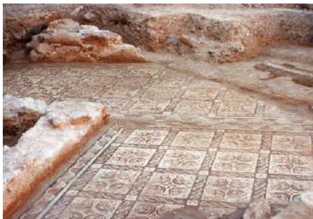
Fig. 25. Restos del zócalo pintado, junto a la banda de enlace de los mosaicos A y B.

Jerónimo Escalera Ureña, técnico del Instituto del Patrimonio Histórico Español (Ministerio de Cultura, Madrid), que en colaboración con Francisco Gago Blanco (técnico del Departamento de restauración del MAN) procedió a la extracción de los mosaicos descubiertos en 1982, nos comunicó personalmente una esclarecedora noticia: una vez levantados los paneles musivos pudieron verse vestigios del estucado que recubría las superficies parietales; bajo uno de ellos apareció el fondo completo de una vasija cerámica con restos de pintura y otros muchos fragmentos de bases de recipientes cerámicos con pintura de colores rojo, ocre, amarillo, verde..., que los constructores romanos dejaron entre los materiales de relleno sobre los que se asentaría el piso elaborado en opus tessellatum (Fig. 24). Estos hallazgos demuestran que el proceso de trabajo consistía en pintar primero las paredes y posteriormente pavimentar las superficies de circulación (acerca de esta problemática, cfr. ALLAG y BARBET, 1972; GUIRAL y MOSTALAC, 1993, 365-392; GUIRAL, en GUIRAL y SAN NICOLÁS, 1998, 25-27; REGUERAS, 2013, 98-100). Igualmente, según sus informaciones, había un rodapié con molduras estucadas y pintadas, que adornaba la zona inferior de los muros (Fig. 25), y en el alzado de dichos paramentos había “líneas intermedias de ladrillos”.