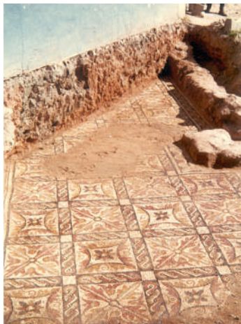
Fig. 2. Pavimento musivo descubierto en el casco antiguo de Alcázar.

confeccionados con teselas de piedra caliza, de diferentes tamaños (1 x 2 cm aprox.) y brillantes tonalidades, utilizándose un amplio espectro de colores en el que dominan básicamente el blanco, negro, rojo, amarillo, azul, verde, siena, morado y gris, e incluso en algunos ejemplares se despliega una policromía aún más rica. En la mayoría de estos lienzos de mosaico se emplearon de seis a ocho tonos, siendo destacable, en especial, una alfombra -la de más fino diseño y perfecto trazado, realizada con teselas de un menor tamaño-, a la que J. San Valero (1956, 197) asignó el número VI, cuya gama cromática abarca doce colores distintos. La equilibrada alternancia de éstos lograba un efecto armónico. Otra peculiaridad reseñable, respecto a los seis restantes, además de un colorido más completo, era la singularidad de su dibujo, de un estilo distinto.