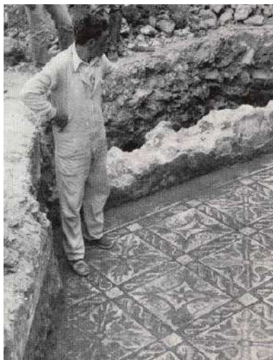
Fig. 6. Mosaico III.

Hasta aquí la descripción de J. San Valero Aparisi. Todos estos pavimentos musivos fueron consolidados y extraídos por el equipo de J. San Valero (1957, 216-217), que esboza muy brevemente en una de sus publicaciones la metodología seguida 4 , con el asesoramiento de J. C. Serra Ráfols.