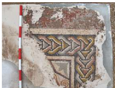
Fig. 12. Panel musivo.

A su vez, en la orla se despliega una hilera de peltas alternantes, de apariencia muy próxima a la de un mosaico de Mérida, del siglo IV (BLANCO, 1978b, 47 ss., lám. 52), junto a una franja con tallos en espiral, como la de otros dos mosaicos de Lyon (STERN, 1967, 21 ss., láms. III-IV; 43 ss., lám. XXV), datados, respectivamente, en la primera mitad del siglo III y en la segunda mitad del siglo II d.C.