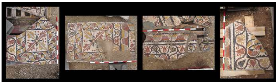
Fig. 8. Fragmentos musivos con flores de loto, hojas de acanto y de hiedera.

La temática compositiva de otro de los pavimentos musivos de Alcázar es un entramado de recuadros contorneados por cintas onduladas tricolores que contienen cálices trífidos entre las ondas, a su vez bordeadas por otra cenefa de largos tallos con zarcillos y hojas de hiedera contrapuestas y, por último, una tercera greca de capullos de loto alternos. En los cuadrados se inscriben rosetones de cuatro pétalos sobre aspa de cuatro hojas de acanto, con cruces aisladas o en grupo intercaladas entre las hojas (Fig. 8). De este ejemplar se conservan apenas unos fragmentos (BLÁZQUEZ, CMRE V , 1982b, 24, láms. 3-4, 44, n.º 14 y 15). Es obvio su parentesco con otro procedente del yacimiento arqueológico de Los Cipreses (Jumilla, Murcia), remontable a mediados del siglo IV, aunque muestra algunas variantes (BLÁZQUEZ, CMRE IV , 1982a, 76-77, lám. 35, n.º 82).