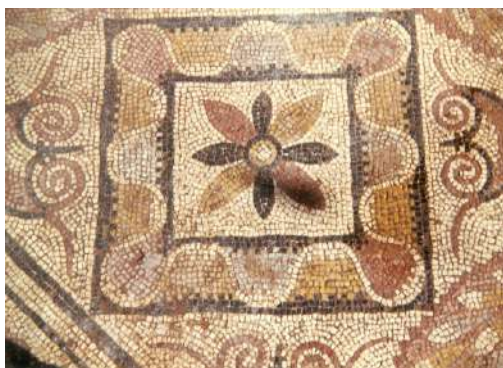
Fig. 17. Detalle de algunos motivos decorativos.

En esta sucesión de coronas y cuadrados al bias, alternan un cuadrante que ostenta un cable de dos cabos, sobre fondo oscuro, a continuación una corona y después otro cuadrado con una cenefa ondulada. En ambos