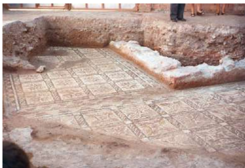
Figs. 31-32. Detalles de los daños sufridos por los mosaicos.

A su vez, el mosaico B presentaba dos grandes lagunas y algunas otras menores, habiéndose perdido por completo el tramo final, como ya hemos comentado. Por lo tanto, los fallos de estos mosaicos afectaban fundamentalmente a los sectores más alejados entre sí, correspondientes a la línea de fachada del inmueble moderno (Figs. 31-32).