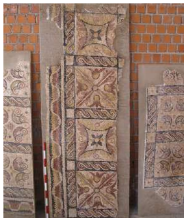
Figs. 3-4. Detalles del mosaico III.