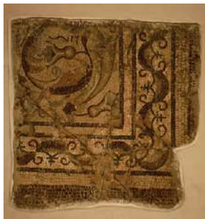
Fig. 9. Composición con motivos vegetales y peltas.

Otros dos paños de mosaico procedentes de este enclave alcazareño, a los que J.M. Blázquez ( CMRE V , 1982b, 24-25, láms. 5 y 44, n.º 16) adjudica una cronología del siglo IV, están decorados con capullos y tallo enrollado en espiral (Figs. 9-10). Algunos detalles recuerdan a un mosaico de Cherchel, en Argelia (DUNBABIN, 1978, 114-115, 254, lám. XL, 102), para el que se ha propuesto una datación en torno al 200-210 d.C. Esos mismos motivos florales se hallan en el mosaico del Dominus Iulius , de Cartago (DUNBABIN, 1978, 62, 119-121, 252, lám. XLIII, 109), fechado entre el 380 y el 400, también en un segundo mosaico de Cartago, el de los Meses y Estaciones, adscrito a la segunda mitad del siglo IV (DUNBABIN, 1978, 121, 251, lám. XLIII, 110) y en tres ejemplares de Tabarka, de cronología avanzada (fines del siglo IV o principios del V, DUNBABIN, 1978, 122, 271-272, láms. XLIV, 111-112; XLV, 113). Muy parecido es el mosaico paleocristiano de San Leucio, en Canosa.