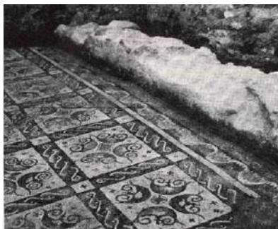
Fig. 7. Mosaico decorado con peltas contrapuestas.

Al estudiar el fragmento musivo con rectángulo y lanza de la villa de Los Quintanares (Soria), de la segunda mitad del siglo IV d.C., J.M. Blázquez y T. Ortego (CMRE VI, 1983, 34, lám. 34, n.º 27) traen a colación uno de los mosaicos de Alcázar de San Juan, que lleva incorporada una guirnalda dentro de un rectángulo, tipológicamente similar.