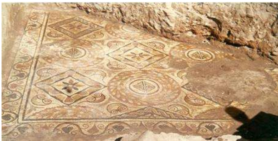
Fig. 14. Mosaico con coronas, in situ.

De temática homogénea, el campo musivo está repartido en una serie de guirnaldas y cuadrados que comprenden representaciones florales (Fig. 14).