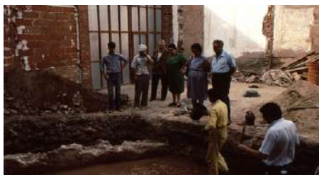
Fig. 23. Mosaico A.

la Escuela Taller Complutum (TEAR, de Alcalá de Henares), al haber sufrido un proceso de gran deterioro.