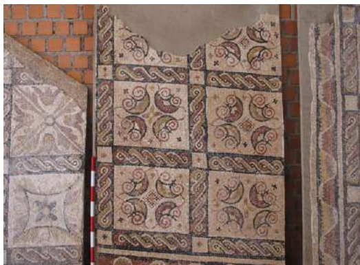
Fig. 5. Detalle del mosaico II b).

El esmerado trazado del dibujo y su equilibrado repertorio decorativo, ordenado en una cadenciosa trama, se conjugan creando un magnífico tapiz, en el que se empleó la más amplia y cálida paleta de colores de todo el elenco musivo: blanco, siena, marrón, rosa, rojo, verde, negro azulado y dos tonos de gris. El cerco exterior es una guirnalda en que “aparecen enlazados unos barrocos