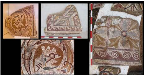
Fig. 10. Fragmentos musivos.

Dentro de nuestras fronteras, esta decoración vegetal se puede cotejar con la de un mosaico de la villa de El Romeral (Albesa, Lérida), del último cuarto del siglo IV (PITA y DíEZ-CORONEL, 1964-1965, 185, láms. XXXIII 4, XXXIV; BLÁZQUEZ-LÓPEZ MONTEAGUDO-NEIRA y SAN NICOLÁS, CMRE VIII , 1989, 16-18, láms. 1-3, 5, 21-22, n.º 4 y 9), también con otros de la villa toledana de Rielves (FERNÁNDEZ CASTRO, en BLÁZQUEZ, CMRE V , 1982b, figs. 35 y 39), de la navarra de El Ramalete (BLÁZQUEZ y MEZQUÍRIZ, CMRE VII , 1985, 62-63, fig. 9, lám. 55, n.º 43; LÓPEZ MONTEAGUDO, 2006-2007, 194), de la de El Hinojal (Mérida), de análoga cronología (BLANCO, 1978b, 51-52, fig. 5, n.º 64), asimismo, del siglo