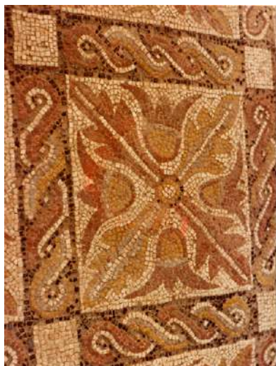
Fig. 28. Detalle de la composición.

por cordones de dos cabos encerrados en rectángulos cuyas dimensiones oscilan entre 46,5 y 50 cm de longitud por 12 ó 13 cm de anchura. El espacio musivo está repartido en sesenta casillas de dimensiones mínimamente variables (unas de 46,5 x 49 cm, otras de 47,5 x 48,5 cm e incluso de 48,5/49 x 50 cm), dispuestas en cuatro calles horizontales superpuestas constituidas por quince casillas cada una (algunas de ellas desaparecidas debido a la existencia de varias lagunas), con pequeños cuadrados en blanco en los cruces de las calles. Inscritas en su interior se repiten secuencialmente dos estilizaciones vegetales distintas, de configuración folicular y floral. Una de ellas consiste en cuatro cálices trífidos bicromos, en ocre y rojo, contrapuestos, de los que no se representan los tallos. Muestran una variación cromática rotativa y se hallan intercalados entre cuatro largas hojas de acanto en aspa unidas por el botón central