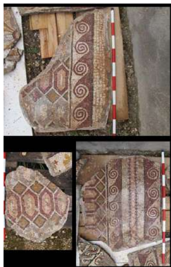
Fig. 13. Diversos paneles musivos.

En otros tres fragmentos de un pavimento en opus tessellatum recuperado por J. San Valero (Fig. 13), el modelo está organizado mediante una serie alternativa de filas de rombos y otras de hexágonos alargados, enmarcados por una línea de postas de