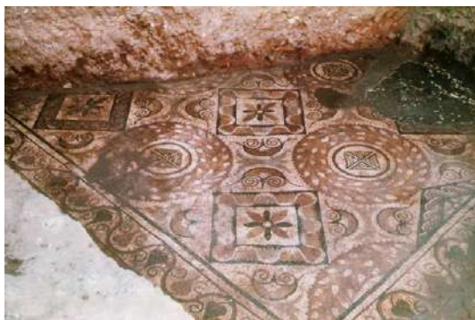
Fig. 18. Detalle de la orla.

Un detalle compartido por el mosaico de Alcázar y otro de la villa de Aguilafuente (Sauquillo, Segovia), del que se conservan dos dibujos en la sede de la RAH (BLÁZQUEZ, 2005-2006, 272-275, figs. 11-12), es el motivo ondulado que define por el exterior algunos cuadrados. Éste se idéntico al de un mosaico de Mérida del siglo III (BLANCO, 1978b, 30, lám. 11, n.º 8), al que rodea algunos de los elementos decorativos de otro mosaico emeritense, de la Huerta de Otero (BLANCO, 1978b, 49, lám. 88 B, n.º 57), datado a fines del siglo II o inicios del III, y al de otro de Balazote (Albacete), donde recorre el contorno de algunos de los círculos englobados en casetones en uno de los tres paños que integran su campo musivo (BLÁZQUEZ-LÓPEZ MONTEAGUDO-NEIRA y SAN NICOLÁS, CMRE VIII , 1989, láms. 26-27). El mismo tipo de línea serpentiforme, pero determinada por dos círculos concéntricos y, a su vez, circunscribiendo otros dos motivos circulares, se plasma en un tapiz geométrico de la villa de La Sevillana (Esparragosa de Lares, Badajoz), del siglo IV, donde los círculos alternan con cuadrados de lados curvos (AGUILAR, 1991, 277, fig. 10).