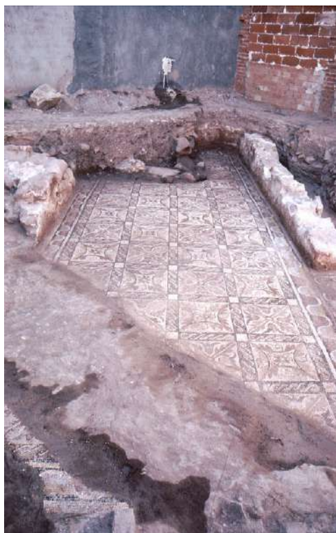
Fig. 27. Mosaico A.

Mide 9,18 m de largo por 3,10/3,15 m de ancho (la anchura oscila ligeramente). Un marco rectangular de grandes teselas define, a modo de orla, el perímetro exterior de la alfombra, recorriendo los ejes longitudinales de la galería a lo largo de los muros. Se trata de una composición ortogonal rodeada por un filete de teselas blancas, de entre 3 y 3,5 cm de ancho, secundada al exterior por una cenefa de línea ondulada (ésta se va ensanchando desde los 14 cm que mide en un extremo del panel hasta alcanzar los 22 cm en el otro).