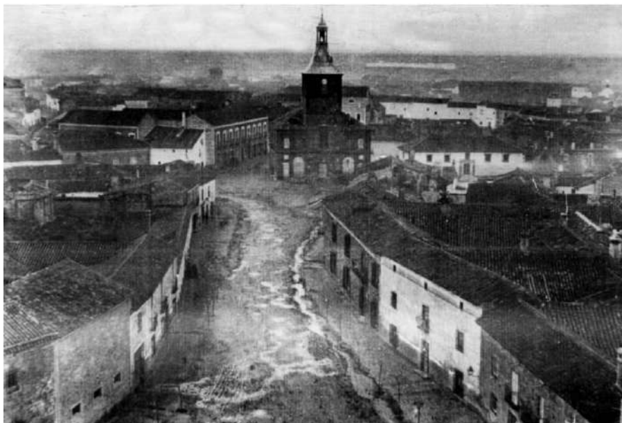
Vista de la Plaza desde Santa Quiteria, en la que se observan los arcos del Ayuntamiento y el Pósito