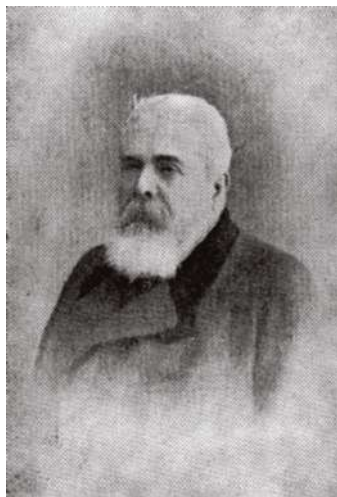
Juan Álvarez Guerra

La descripción realizada por Diego Miranda en el periódico El Día , el 4 de enero de 1899, nos muestra su carácter y personalidad: "Juan Álvarez Guerra era hidalgo y demócrata, aristócrata y popular, era un rico y amante de las prerrogativas del ciudadano; por su carácter hombre de lucha y por temperamento y afición, enérgico defensor de la ley, altanero con Narváez en Gobernación y con el conde de las Cabezuelas en Alcázar, y modesto, bondadoso y pródigo en regalar posiciones y beneficios a todo el mundo y singularmente a sus paisanos, era un hombre que luchaba en el seno de las borrascas sociales, peleaba a campo abierto, con el aliento de su fe y el impulso de su bravo corazón, y su luchar constante no fue infructuoso, nos legó una fortuna, un pleito ganado, una fundación y derecho que por la órbita del tiempo había de venir a consolidarse en Alcázar de San Juan" 42 .