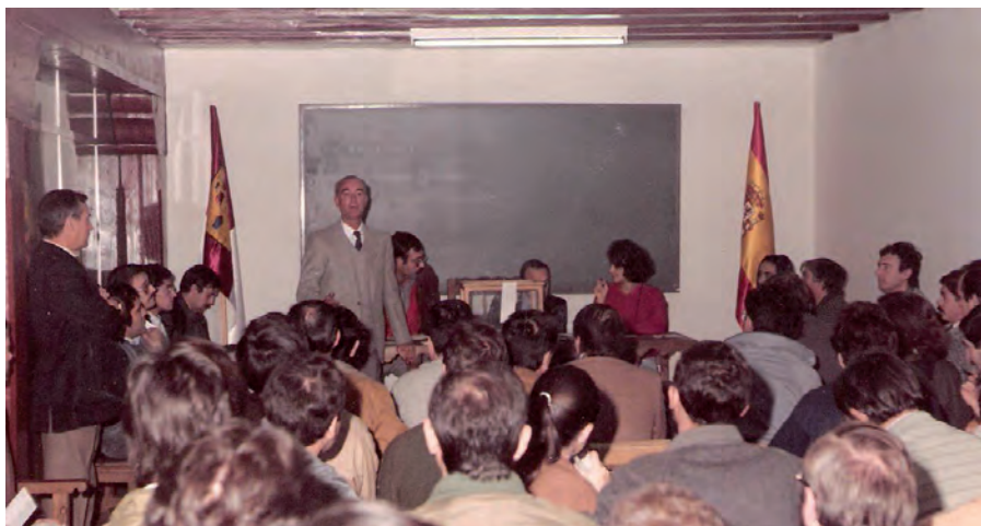
Asamblea de la Federación. 1985