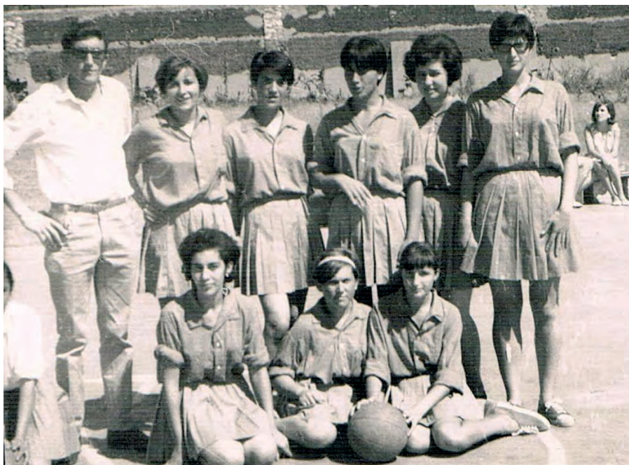
Equipo RAMSÉS I (1964).