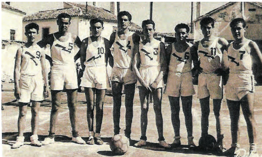
Equipo HÉRCULES C.B. (1954).