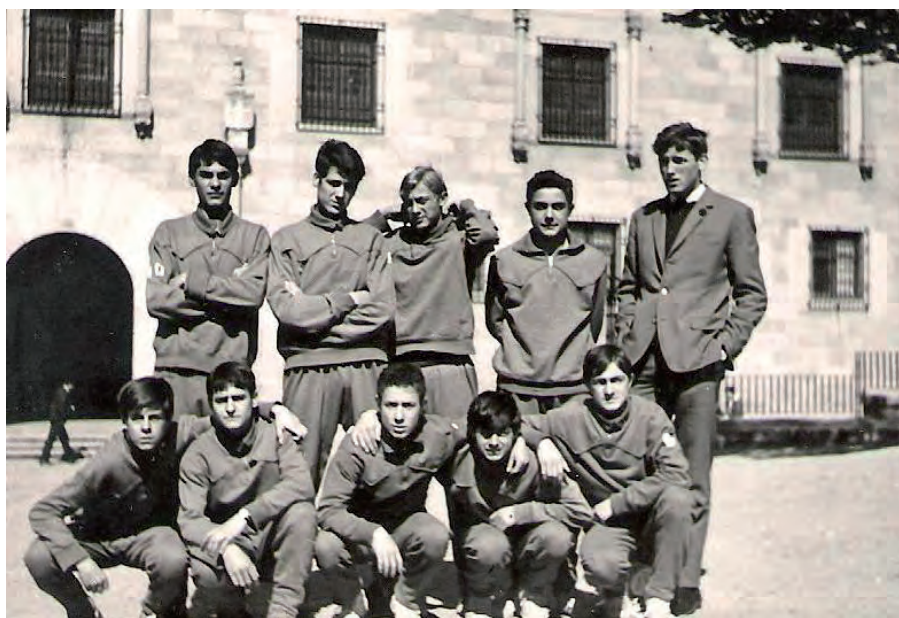
Equipo RENFE Infantil (1967)

Todas las eliminatorias se resolvieron favorablemente en este orden; Día 5, Alcázar 35-León 24; Día 6, Alcázar 45-Zaragoza 16; Alcázar 35-Madrid 26 y la final Día 7, Alcázar 34-Melilla 30, proclamándose CAMPEÓN DE ESPAÑA INFANTIL de 1967.