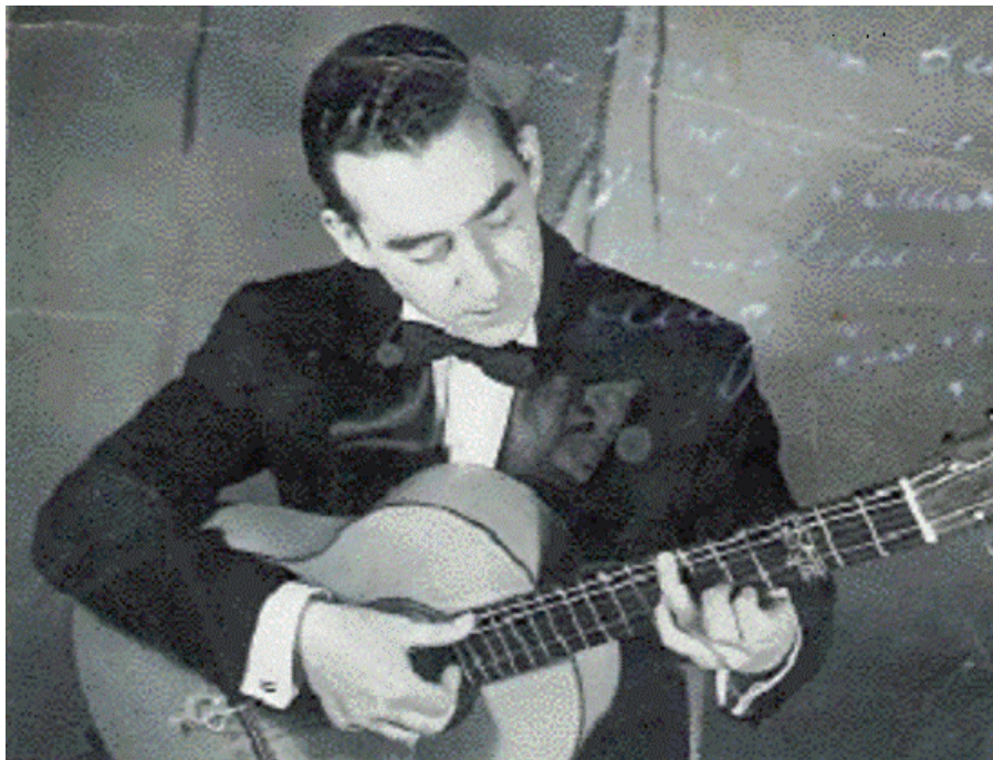
La Habana. 17 de mayo de 1947, tocando para "Cabalgata de Artistas".