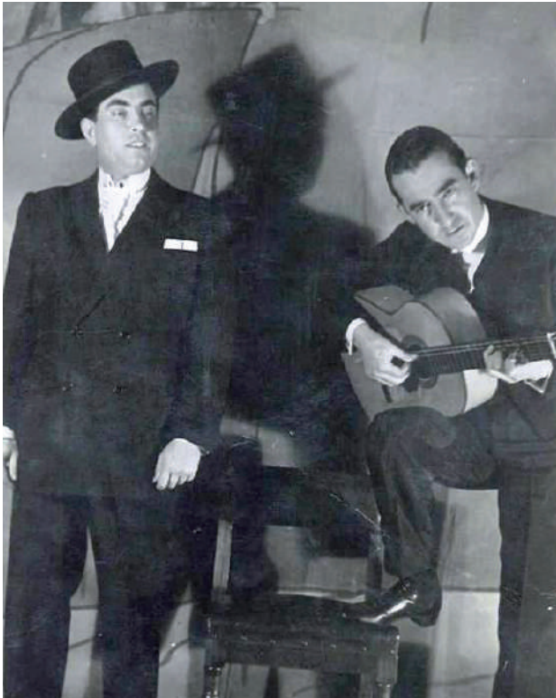
Actuando en el Teatro Municipal de Santiago de Chile junto a Pepe Marchena para cabalgata de artistas. 29 de julio de 1946. Después de esto, Marchena regresaría a España.

San Juan, Tucumán, Santa Fe, Misiones, Santa Cruz o Mendoza, donde la afición al flamenco estaba muy extendida. Sin embargo, las actuaciones más representativas se hacían principalmente en la capital, donde se encontraban las salas más importantes del país dedicadas al género, pudiendo destacar entre ellas: "El Tronío", colmao flamenco de lujo ubicado en la calle Corrientes, al cual asistía la gente más selecta de Buenos Aires. Disponía de tres salas en tres niveles distintos, dedicándose el segundo nivel exclusivamente a espectáculos flamencos de calidad. Se hacían tres funciones diarias: matiné, vermouth y noche, con figuras nacionales e internacionales. Esta sala, al igual que el "Sevilla Colmao", tenía escenarios de buenas dimensiones, bastidores en los laterales y foso para la orquesta. El Tronío cerró sus puertas definitivamente en 1966, años antes lo había hecho el Sevilla Colmao.