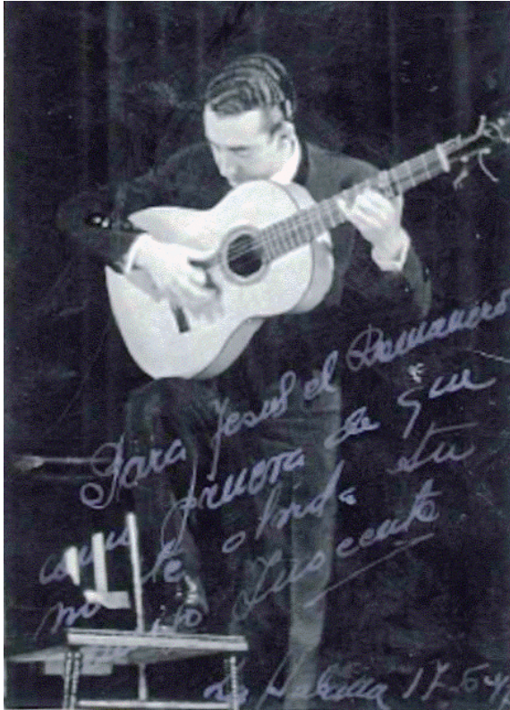
La Habana. 17 de mayo de 1947, tocando para "Cabalgata de Artistas".