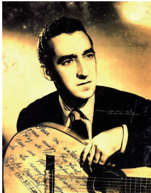
Buenos Aires. 22 de diciembre de 1948.